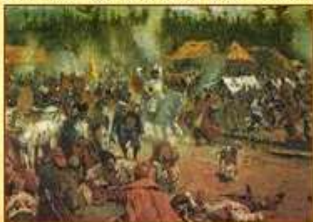
С. Иванов. Смутное время